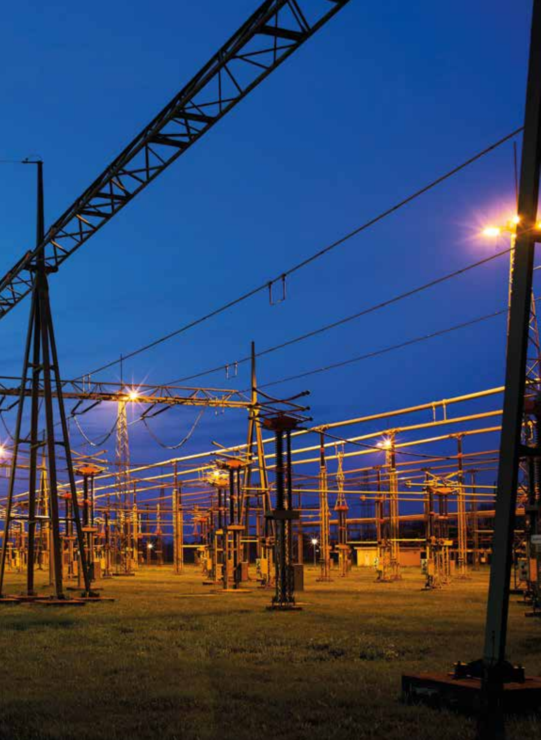
Umspannwerk Dornbirn Werben