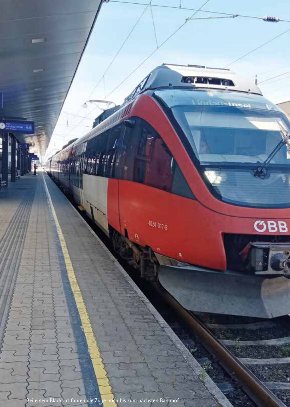
Bei einem Blackout fahren die Züge noch bis zum nächsten Bahnhof.