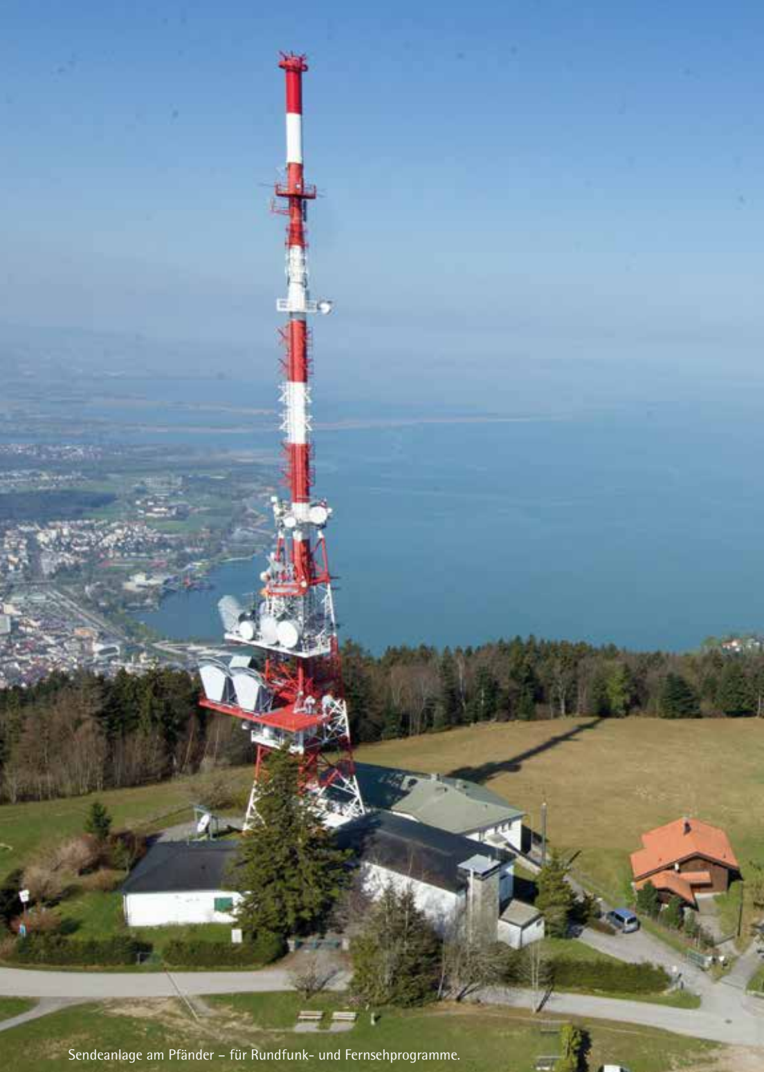
Sendeanlage am Pfänder – für Rundfunk- und Fernsehprogramme.