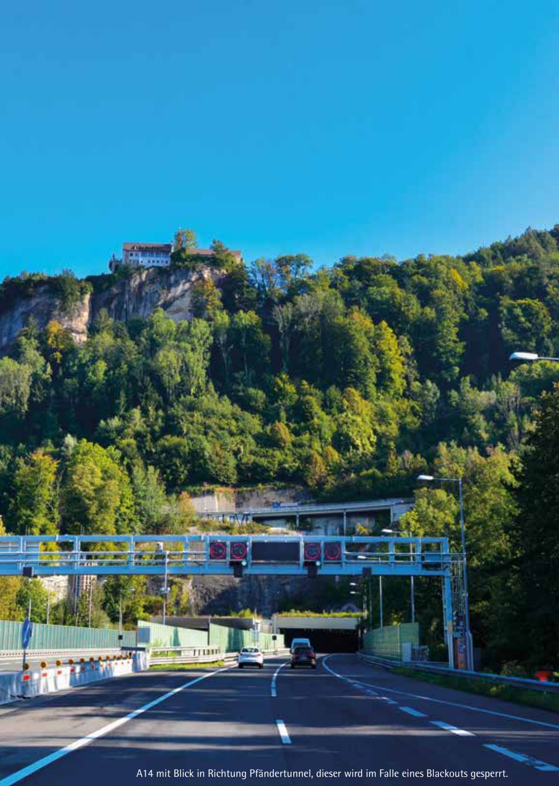
A14 mit Blick in Richtung Pfändertunnel, dieser wird im Falle eines Blackouts gesperrt.