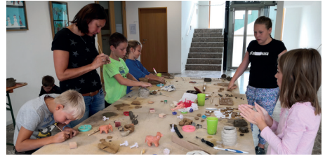
Die Töpfersachen können bei uns im Gemeindeamt abgeholt werden.